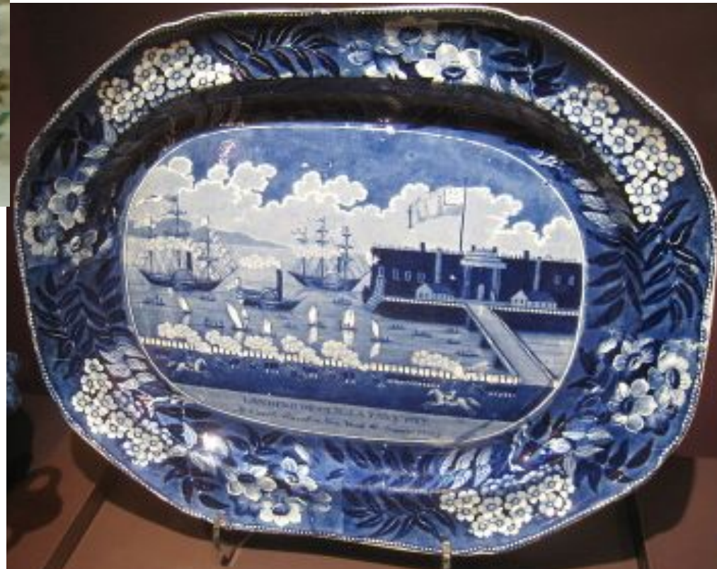
Staffordshire platter, c. 1825, Daughters of the American Revolution Museum, Washington, D.C.