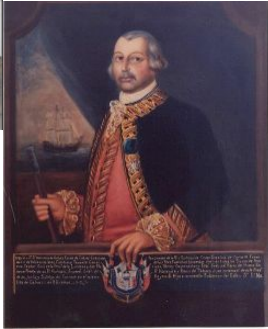
Portrait of Bernardo de Gálvez