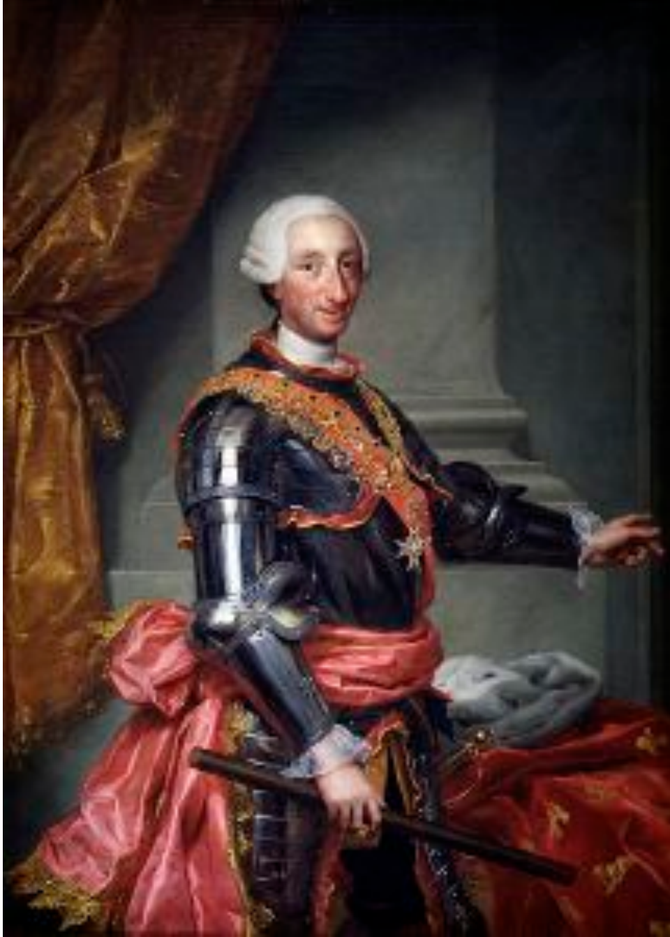
Anton Raphael Mengs, Portrait of Carlos III of Spain, 1761, Prado Museum