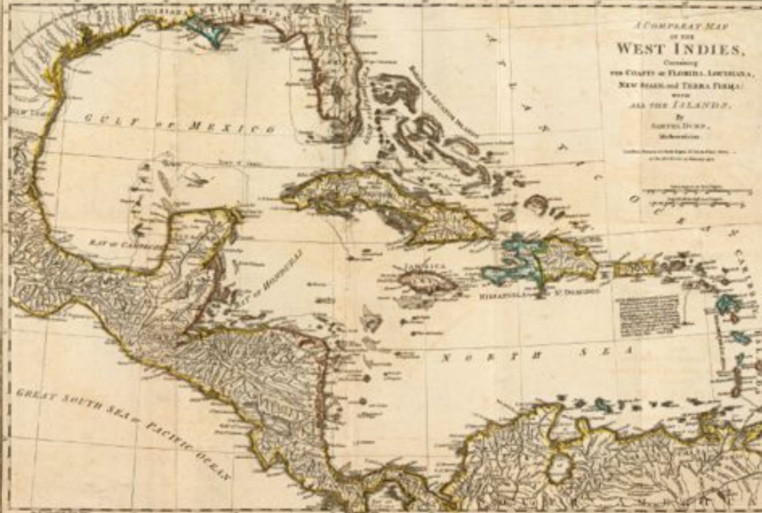
Samuel Dunn, A Compleat Map of the West Indies, . . . (London, 1776)