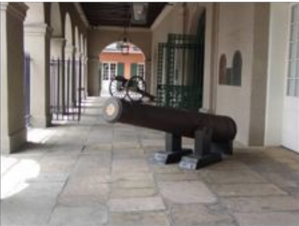
The Cabildo