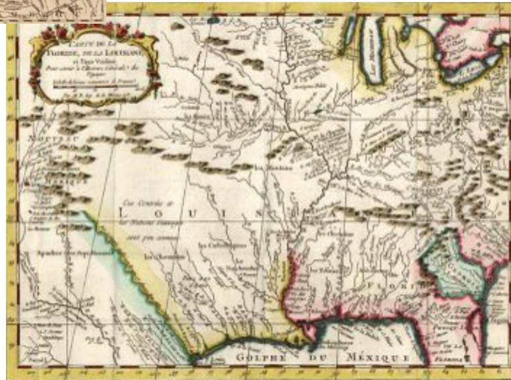
Jacques Nicholas Bellin, Carte De La Floride, De La Louisiane, . . . (Paris, 1780)