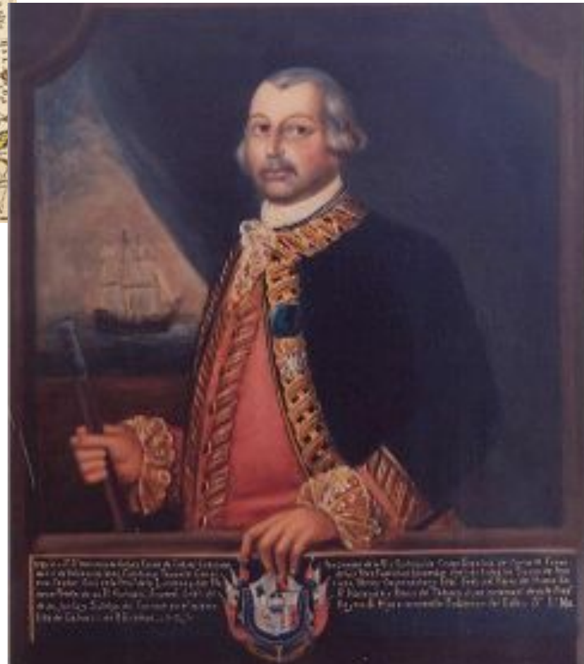
Portrait of Bernardo de Gálvez